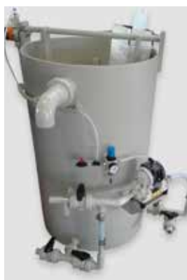
Fig. 1: UniPrep® ISOtect antes da instalação