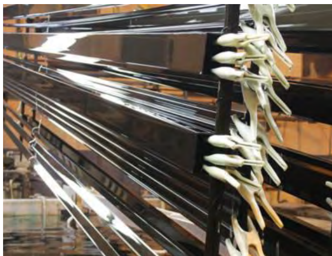
Um dos processos de anodização na fábrica da Prodec