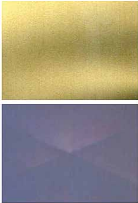
Imagem 1: Variação na tonalidade do substrato ferroso, mediante a conversão base Zr.

As camadas de conversão, base zircônio, tendem a produzir sobre substratos ferrosos, uma coloração que vai desde o amarelo leve até o azul iridescente, como ilustra a foto abaixo: